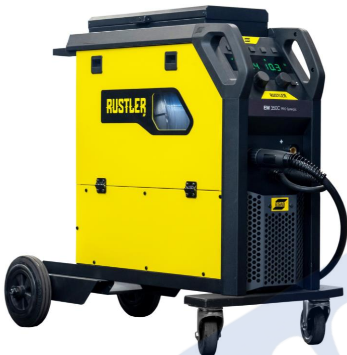
Rustler EM 350C PRO Synergic

La gamme d'onduleurs de soudage compacts Rustler MIG PRO est votre solution de choix pour les défis de soudage les plus courants. Dotés de la toute dernière technologie onduleur, ils allient une faible consommation d'énergie à des performances de soudage optimisées.